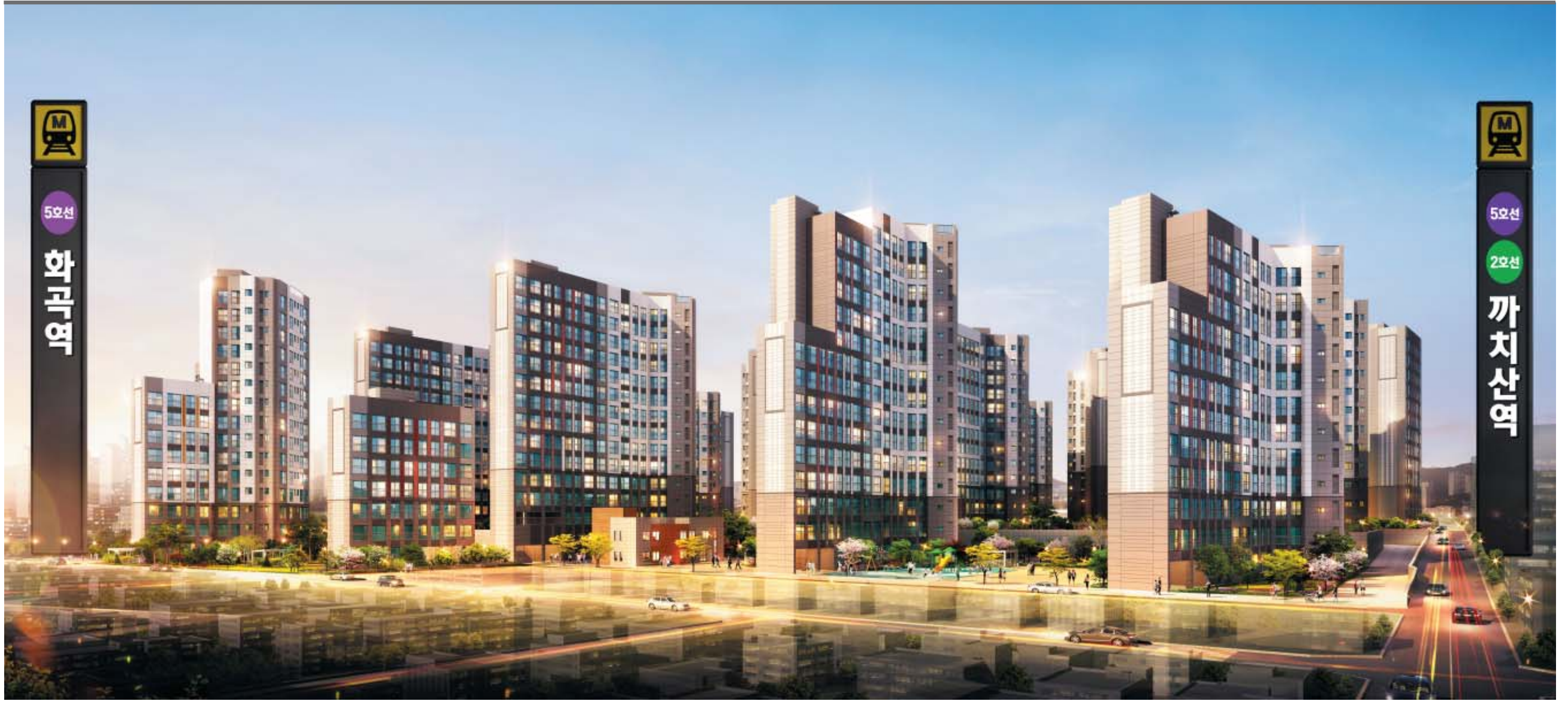
서울 강서구 화곡동에 들어서는 '강서파크원'은 지하철 2·5호선 환승역인 까치산역을 가까이에서 이용할 수 있는 더블 역세권 단지다.