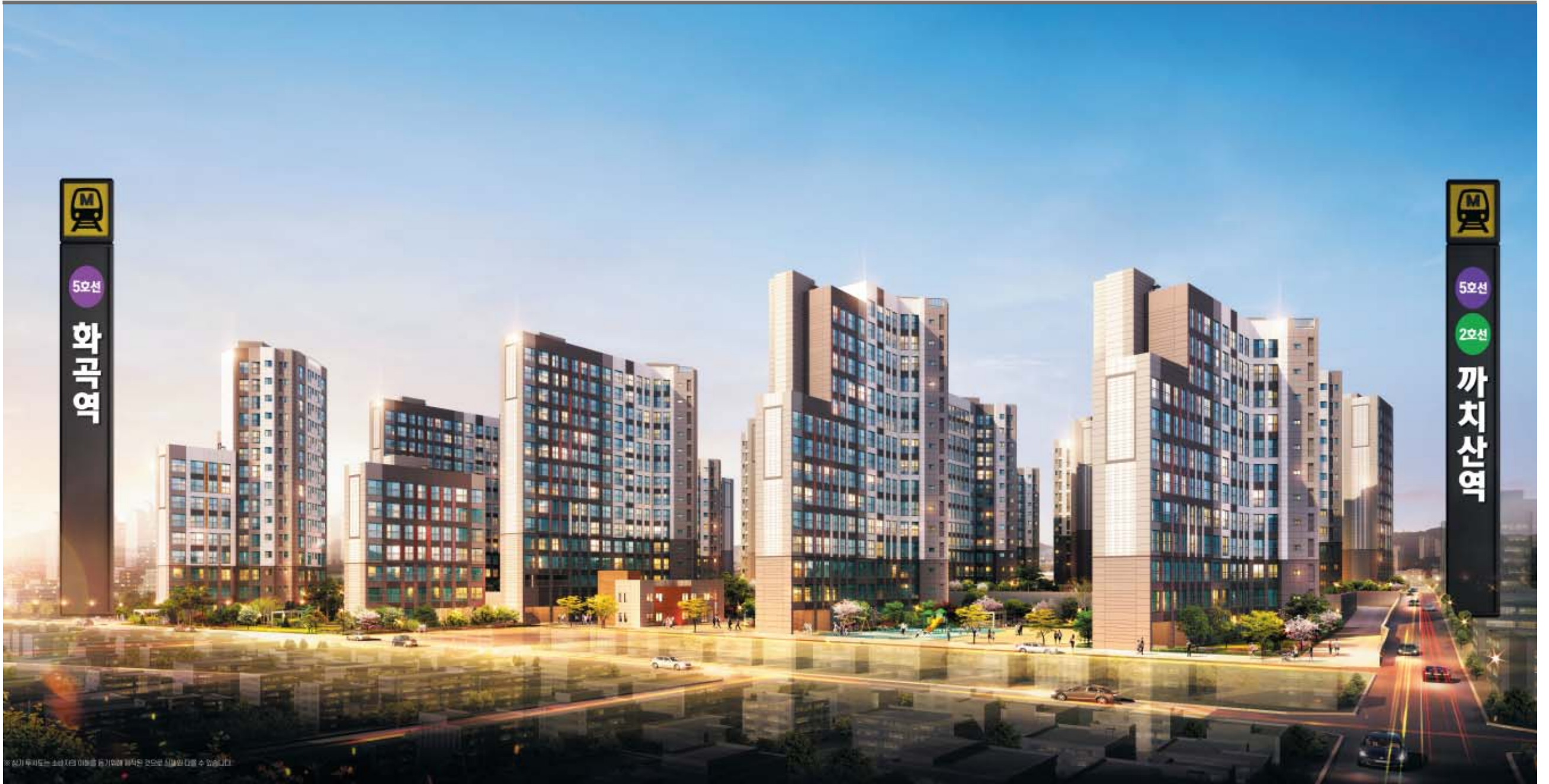
서울 강서구 화곡동 424번지 일원에 들어서는 지역주택조합 아파트 '강서파크원'이 편리한 생활 인프라와 저렴한 공급가로 관심을 끌고 있다.