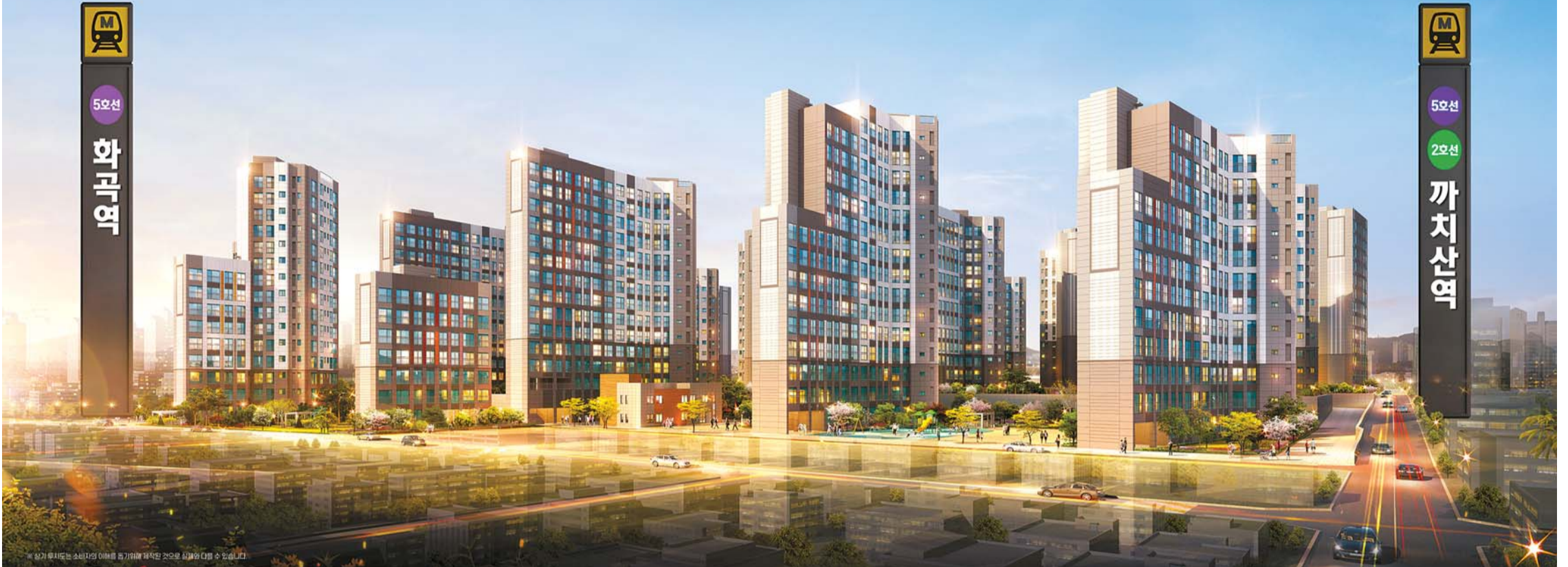
까치산역 더블역세권에 들어설 예정인 강서파크원(조감도)의 경우 공급가가 인근 마곡지구 아파트 시세의 절반 수준에 불과한 데다, 주변에 다양한 개발호재가 진행 중이어서 실수요자는 물론 투자자의 관심이 크다.